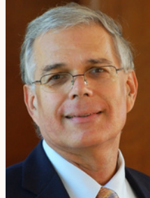
(ශාස්ත්‍රපති උපාධිය) අලින් ගිවිසුම පිළිබඳ කීර්තිමත් මහාචාර්ය, ආචාර්ය එක්හාර්ඩ් ජිනාබෙල්