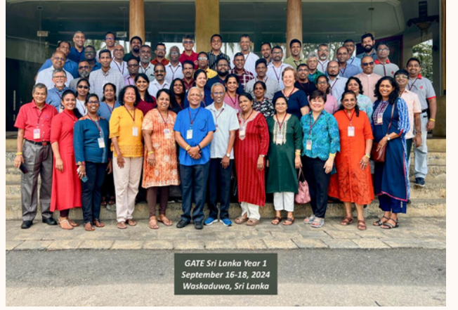
GATE Sri Lanka Year 1 September 16-18, 2024 Waskaduwa, Sri Lanka