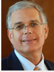
புதிய ஏற்பாட்டின் புகழ்பெற்ற பேராசிரியரான கலாநிதி. எக்கார்ட் ஸ்னாபல் கற்பிக்கும் முதுகலைமாணி பாடநெறி